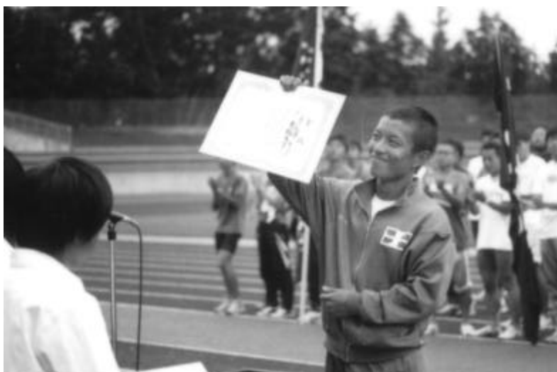
10年ぶりの七大戦優勝