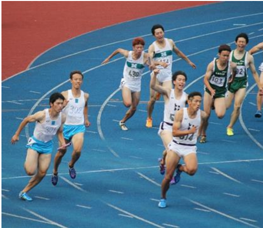
七大戦の時のような勝利が期待される4継