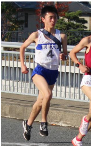
新チーフとして丹後駅伝と京都駅伝を しっかりと走りきった。