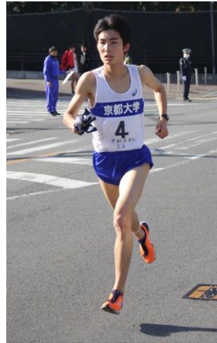
これからチームの要になることが期待 される足立。