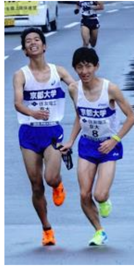
柴田から稲垣へタスキが渡る。 二人は重要な区間を走りきった。